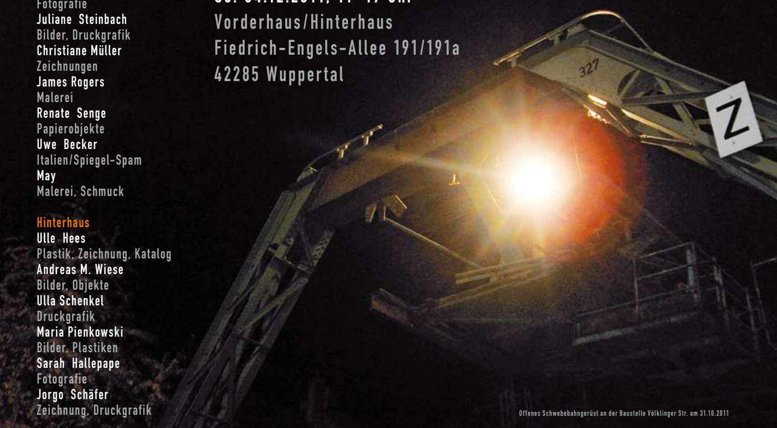
Offenes Schwebegängergerüst an der Baustelle Völklinger Str. am 31.10.2011