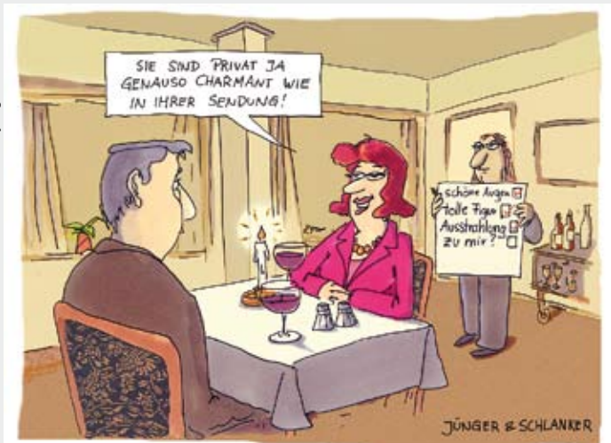
jünger & schlanker

„Im Zweifel für unsere Überzeugung lieber mal eine Wahl verlieren als den Verstand.“ Okay, Herr Brüderle, wenn man allerdings eine Wahl nach der anderen in den Sand setzt, dann kann man freilich schon den Verstand verlieren, vorausgesetzt, man hatte irgendwann mal einen, gell?